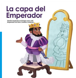
La capa del Emperador

https://librosaccesiblesrd.org/libros/la-yuca